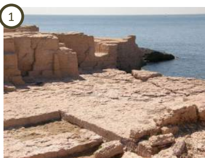
1 Les carrières de la pointe de Baou Tailla – Carro