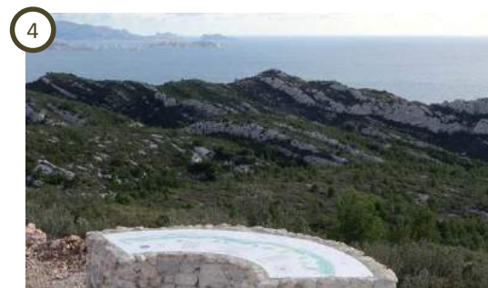
4 Table d'orientation des Caucarières - Ensues