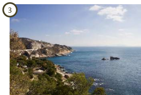
3 Vue panoramique Le Grand Mornas – Carry-le-Rouet