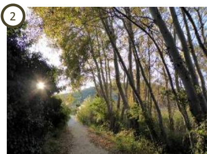
2 Roselière du Grand Vallat – Sausset-les-Pins